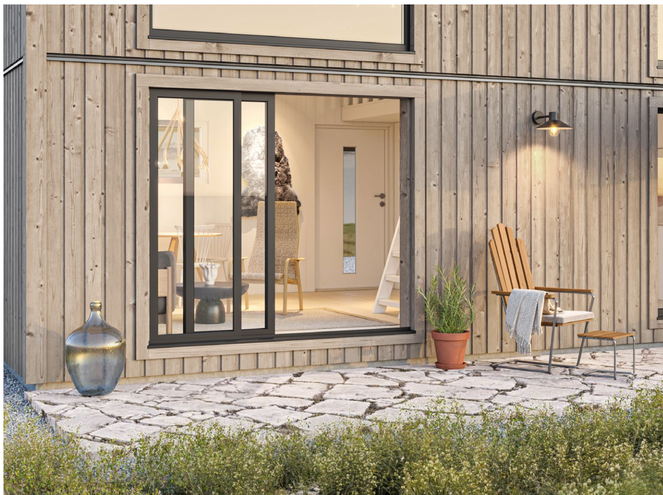
Skjutglaspartier på baksidan och fönster upp till loftet ger ett härligt ljusflöde genom huset.

När du kompletterar din stuga med Basecos interiörprodukter får du exakt rätt mängd material – golv, panel och detaljer i hållbar kvalitet och tidlös stil. En långsiktigt hållbar investering i absolut norrländsk kvalitet.